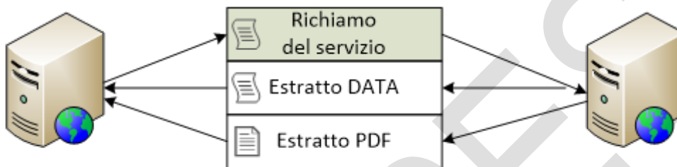
Figura 1: Rappresentazione schematica della funzione delle interfacce descritte

La presente istruzione tratta il richiamo del servizio relativo a un estratto.