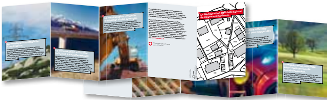
Image commune et homogène: la boîte à outils élaborée par le groupe RP de Géomatique Suisse est destinée à proposer à tous les partenaires une présence visuelle homogène. Les moyens de communication et de promotion de la Mensuration Officielle Suisse aideront les partenaires concernés à mieux communiquer son utilité à l'économie et l'opinion publique. Utilisez nos moyens de communication pour apporter votre contribution.

Dépliant 10 pages, avec argumentaire et texte explicatif. Format 13 x 19 cm (format carte géographique), de/fr/it/rm. Un premier tirage de 200 000 dépliants (sans impression!) est mis gratuitement à disposition jusqu'à épuisement des stocks. Pour un prix indépendant de la quantité, vous recevez les dépliants avec impression du logo et de l'adresse de votre entreprise (n/b sur la dernière page).